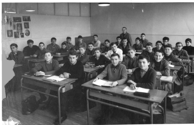
Une classe de 4 e en 1970