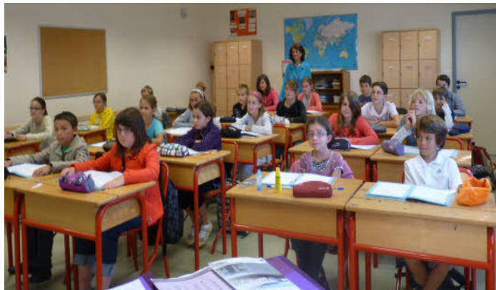
Une classe de 4 e en 2010

Trouvez trois différences entre le collège d'hier et celui d'aujourd'hui